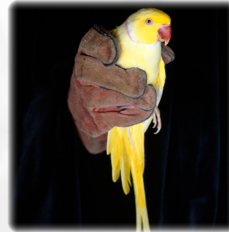
© 'Comings & Goings - Bird series' - Casey Orr.

«REPRÉSENTATIONS DU POUVOIR ET POUVOIR DE L'IMAGE DANS LA PHOTOGRAPHIE CONTEMPORAINE BRITANNIQUE ET AMÉRICAINE»