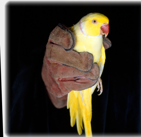
© 'Comings & Goings - Bird series' - Casey Orr.