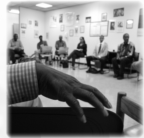
"Discussion about men's health at Project Brotherhood, a clinic dedicated to serving the needs of Black men on the South Side of Chicago", de "Securing Food in Chicagoland."

Entre images du pouvoir et pouvoir de l'image, cette troisième Journée d'Étude s'intéressera aux représentations du pouvoir et au pouvoir de la représentation dans la photographie contemporaine britannique et américaine.