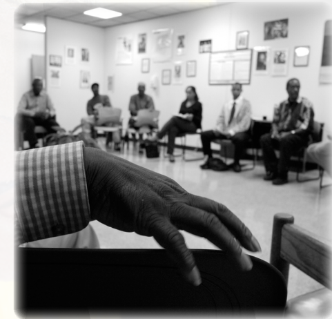
-Discussion about men's health at Project Brotherhood, a clinic dedicated to serving the needs of Black men on the South Side of Chicago-. de -Securing Food in Chicagoand.-